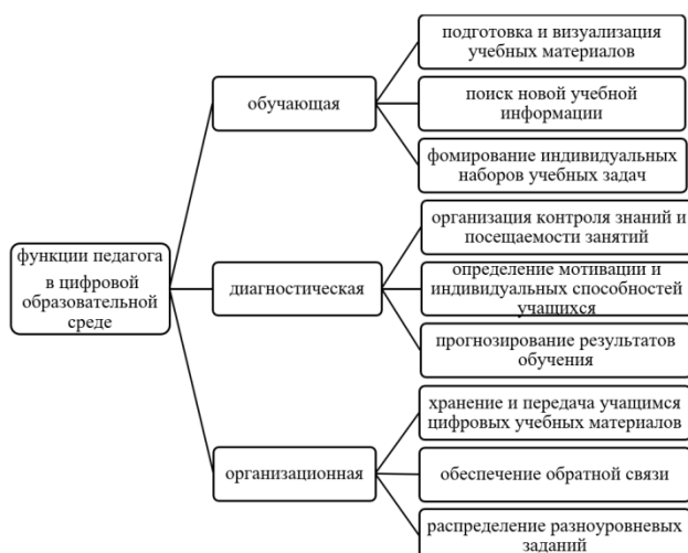
Р и с. 1. Функции педагога в условиях цифровой образовательной среды