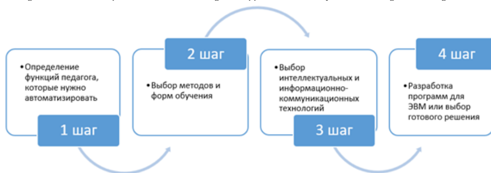
Р и с. 3. Технология автоматизации функций преподавателя информатики F i g. 3. Technology for automating the functions of a computer science teacher