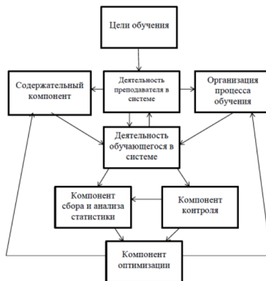
Р и с. 1. Структурная модель компьютерной обучающей системы Fig. 1. Structural model of the computer-based learning system

Целевой компонент определяет деятельность преподавателя в системе, которая выражается в построении содержания и методов обучения. Содержательный компонент включает в себя теоретический и практический материал, который составляет содержание курсов в системе. Компонент контроля позволяет определить, достигнуты ли цели обучения. Компонент сбора и анализа статистики позволяет сохранять сведения о работе обучающихся в образовательной системе.