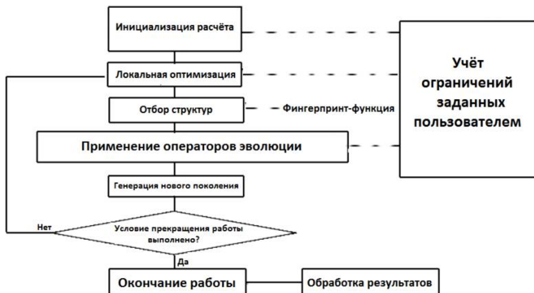
Рис.1. Схема работы алгоритма USPEX

После релаксации заданный процент лучших структур в поколении отбирается для создания следующего поколения с помощью эволюционных операторов. В коде USPEX реализовано несколько функций соответствия, использование конкретной из них определяется при инициализации расчёта. Детали работы эволюционных операторов описаны ранее [2, 9]. Для сохранения разнообразия в популяции, критично важного для эффективной работы эволюционного алгоритма, также добавляется некоторое количество случайных структур. После чего все итерации повторяются ещё раз пока не выполняются критерий остановки расчёта (по умолчанию это неизменность лучшей структуры в течение фиксированного числа поколений).