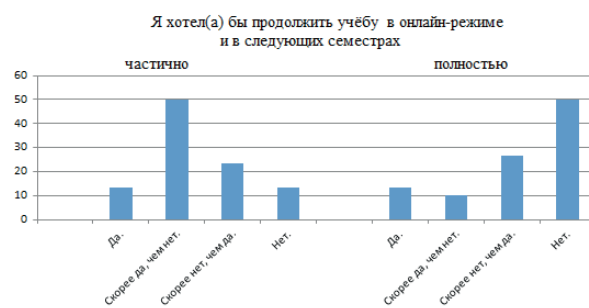
Р и с. 2. Отношение студентов КубГУ к продолжению обучения в онлайн-режиме

В ходе нашего исследования выявлено, что хотели бы продолжить учёбу в онлайн-режиме и в следующих семестрах 13,3 % опрошенных студентов, «скорее да, чем нет» – 10 %. Хотели бы продолжить учёбу частично в онлайн-режиме и в следующих семестрах 13,3 % и «скорее да, чем нет» – 50 % (рисунок 2).