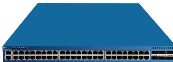
Р и с. 1. Коммутатор Т-Ком ТДК-361-48/6-М 4

На территории России компания D-Link занимается разработкой и производством оборудования с 2007 года. В Рязани расположен производственно-логистический центр компании. В 2021 году было открыто совместное предприятие D-Link и Росатома, которое выпускает телекоммуникационное оборудование под торговой маркой «Т-Ком».