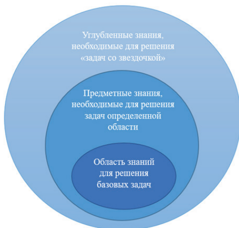
Р и с. 2. Модель ранжирования знаний F i g. 2. Knowledge Ranking Model

ветами на уровень выше. На всех последующих уровнях представлены только вопросы, которые являются уточнением/углублением вопроса предыдущего уровня 2 [13-16]. Онтологическая модель, используемая как основа системы тестирования, включает в себя совокупность логико-семантических графов с их внутренними и наружными связями.